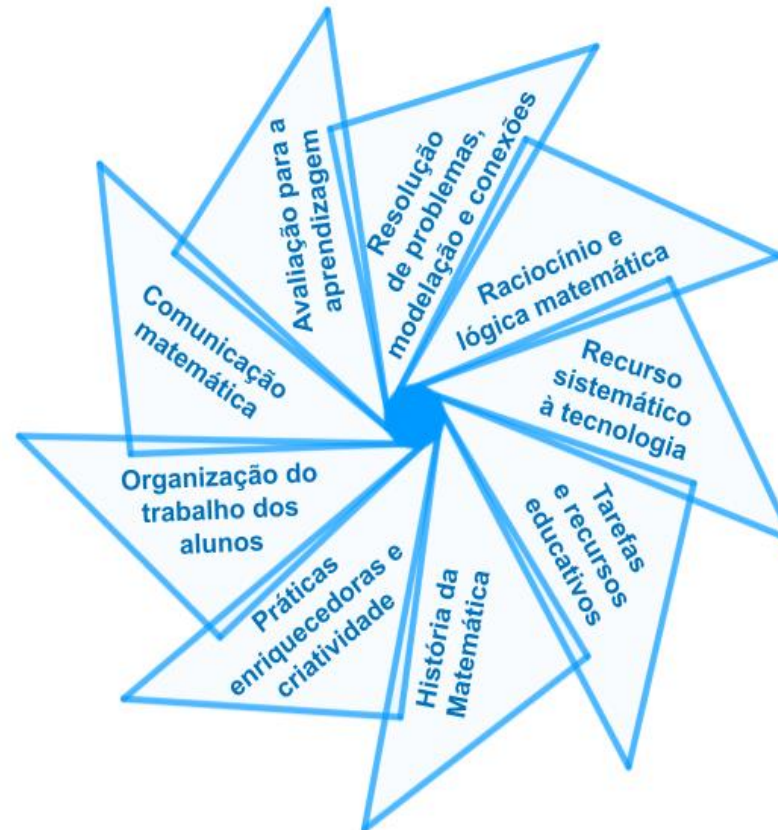
Figura 1. Ideias chave das aprendizagens essenciais

As Aprendizagens Essenciais de Matemática no ensino secundário dão continuidade às aprendizagens do ensino básico e assumem um conjunto de princípios e orientações metodológicas, cuja concretização e especificação é feita para cada ano de escolaridade e tema matemático. A seguir, enunciam-se e apresentam-se as nove ideias-chave preconizadas nas Aprendizagens Essenciais, esquematizadas na Figura 1: